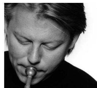
Ole Edvard Antonsen Trompete