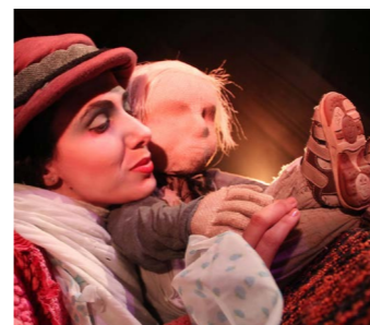
Cia. Caixa de Elefante Companhia de Bonecos Brasil