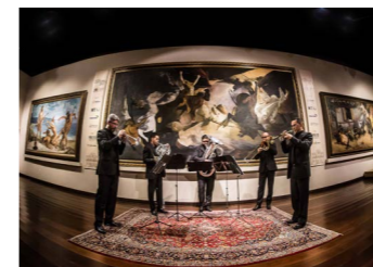
Quinteto Porto Alegre Quinteto de Metais