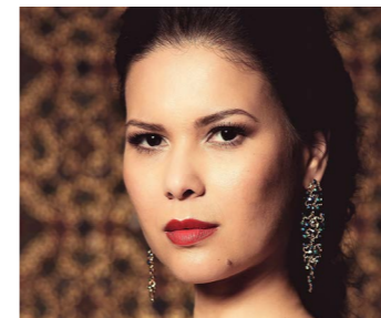
Raquel Fortes Soprano Brasil